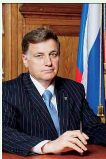
Председатель Законодательного собрания Санкт-Петербурга, Секретарь Санкт-Петербургского отделения партии «ЕДИНАЯ РОССИЯ» В.С. МАКАРОВ